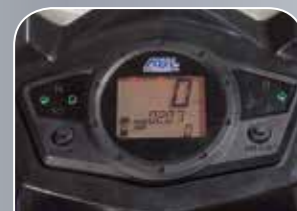
Cockpit mit Tankanzeige, Drehzahlmesser und Uhr