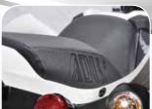
große, bequeme Sitzbank für 2 Personen