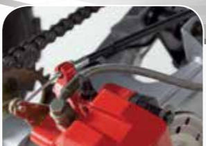
Stahlflex-Bremsleitungen für ideale Dosierbarkeit