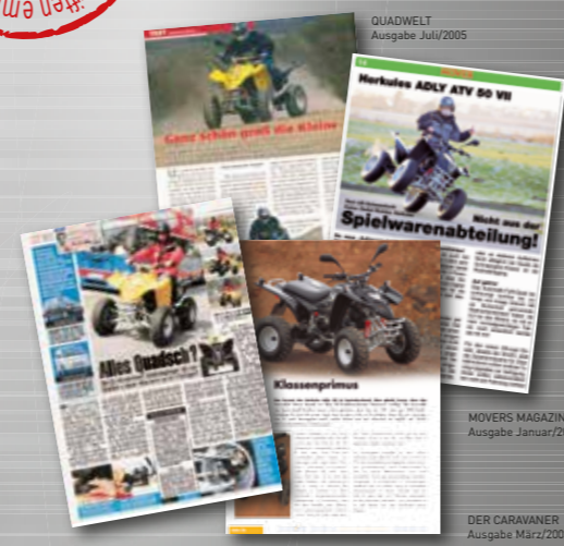
Abb. Interceptor 50 XXL