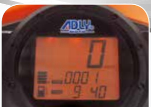
Cockpit mit Tankanzeige, Drehzahlmesser und Uhr