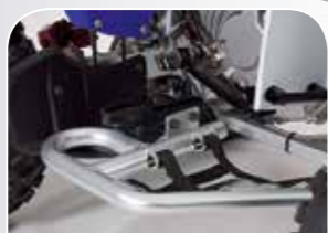
serienmäßig inklusive Alu-Nerfbars