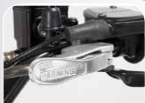
getrenntes Bremssystem, zusätzliche Parkbremse