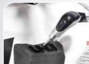
Geländeuntersetzung High- Low-Gear mit Rückwärtsgang