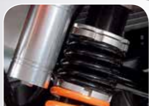
in Zug- und Druckstufe verstellbare Federung