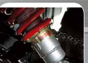
verstellbare Federbeine vorn und hinten