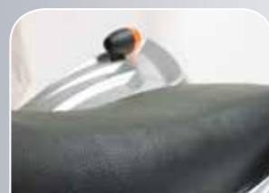
Bequeme Sitzbank mit Stauraum