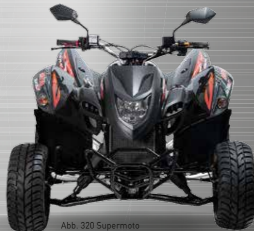
Abb. 320 Supermoto

++ Supermoto der Spitzenklasse ++ ++ perfekte Straßenabstimmung ++ ++ für echtes Rennfeeling ++ ++ atemberaubendes Kurvenverhalten ++