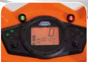
Cockpit mit Tankanzeige, Drehzahlmesser und Uhr