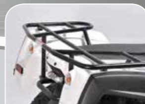
ausreichend Stauraum auf zwei Gepäckträgern