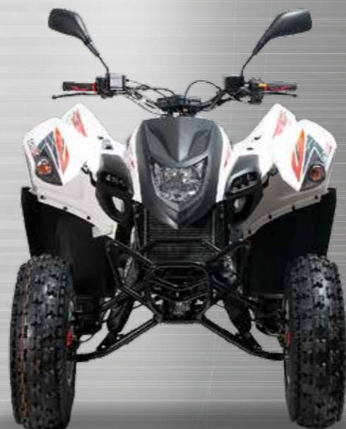
Abbildung: Hurricane 320 inkl. Alufelgen