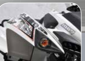
modernes Design auf den Kotflügeln