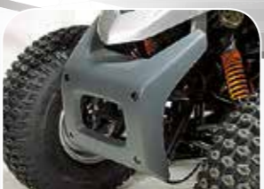
Solider Rammschutz im Frontbereich