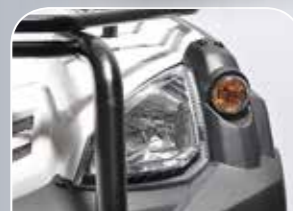
leuchtstarke und form- schöne Halogenscheinwerfer