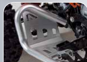
sportliche Alu-Nerfbars inklusive