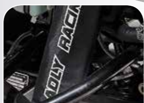
voll einstellbares, staubgeschütztes Fahrwerk