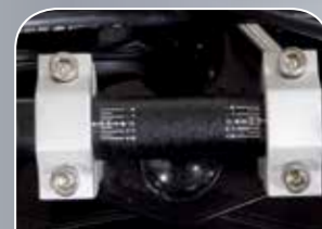
verstellbarer Sportlenker mit Einstellskala