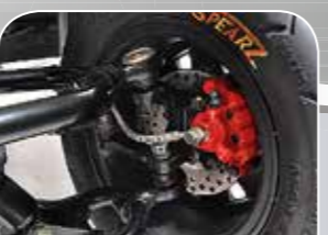
Scheibenbremsen mit Stahlflexbremsleitungen