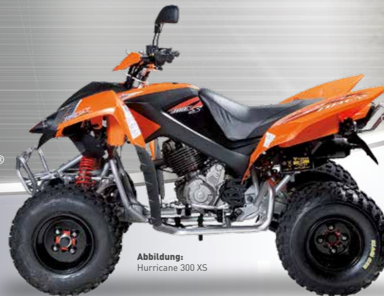
Abbildung: Hurricane 300 XS