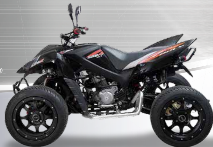
Abbildung: Hurricane 500 S Flat