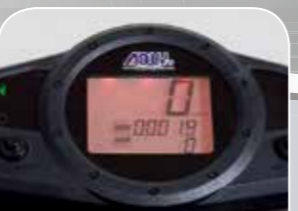
Cockpit mit Tankanzeige, Drehzahlmesser und Uhr