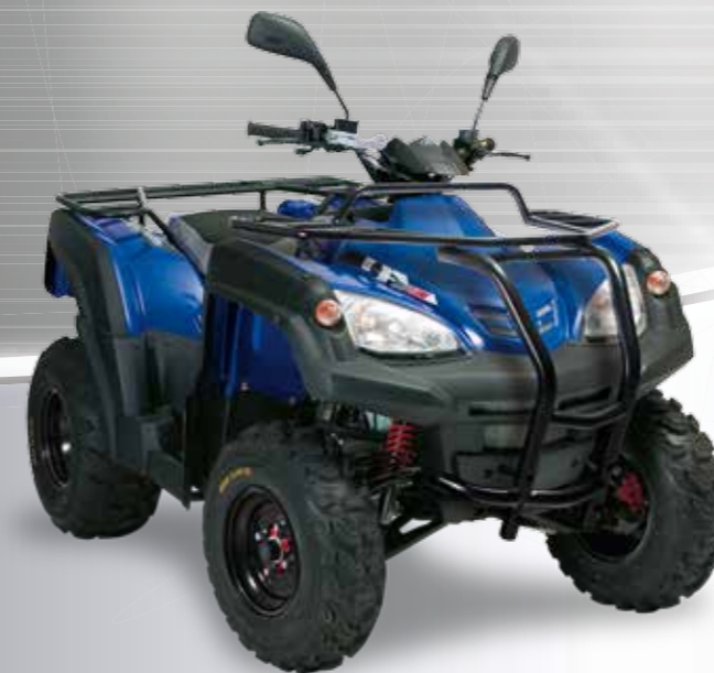
Abbildung: Canyon 320 SE