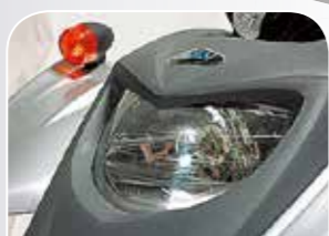
Leuchtstarke und form- schöne Scheinwerfer