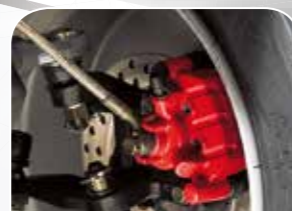
Einzelradbremse mit Stahl- flexbremsleitungen