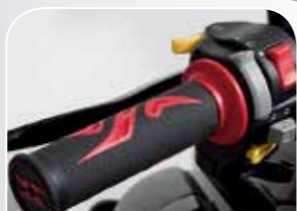
Handgriffe mit Tribal-Design