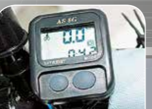
Gut ablesbare Instrumente