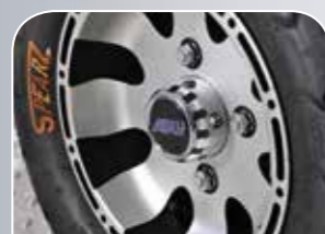
Straßenbereifung auf Aluminiumfelgen