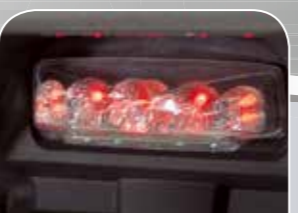
modernste, wartungsfreie LED-Rückleuchte