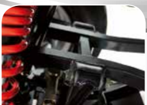
robuster Rahmen aus stabilem Vierkantmaterial