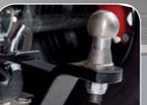
Hurricane 500s LOF Flat inkl. vormontiertem LOF Kit