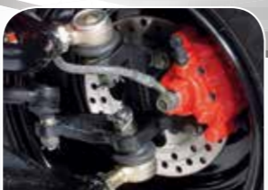
Scheibenbremsen und Stahlflex-Bremsleitungen