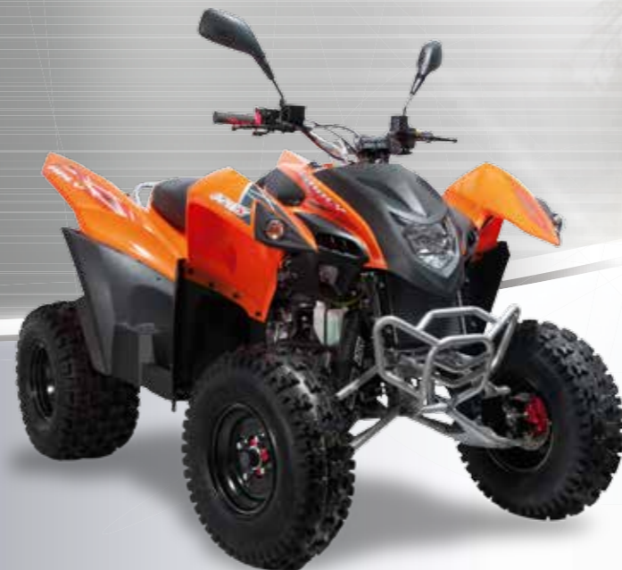
Abbildung: Hurricane 320 SE