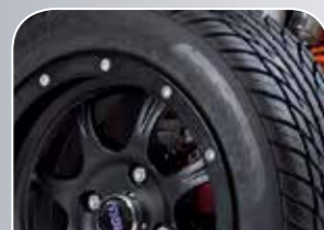
sportliche Straßenbereifung auf Alufelgen