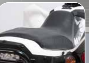
große, bequeme Sitzbank für 2 Personen