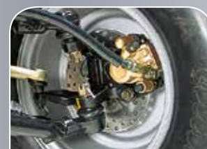
höchste Sicherheit durch Scheibenbremsen rundum