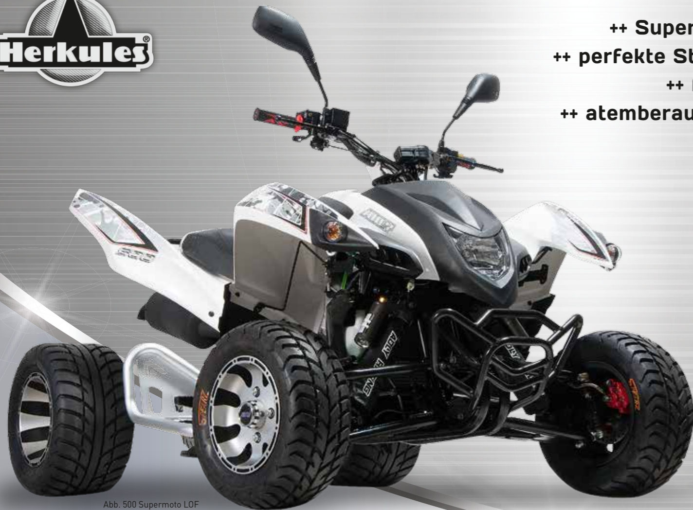
Abb. 500 Supermoto LOF

++ Supermoto der Spitzenklasse ++ ++ perfekte Straßenabstimmung ++ ++ für echtes Rennfeeling ++ ++ atemberaubendes Kurvenverhalten ++