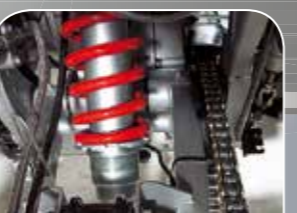
stufenlos verstellbares Cross-Link Federbein hinten