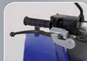
getrennte Bremsen für Vorderrad und Integralbremse