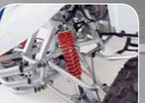
doppelte A-Arme vorn