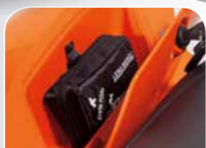
drei Staufächer für nütz- liche Utensilien