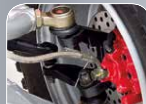
Einzelradbremse mit Stahlflexleitungen