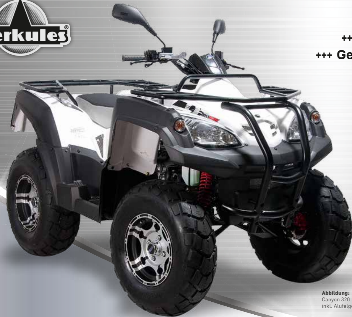
Abbildung: Canyon 320 inkl. Alufelgen