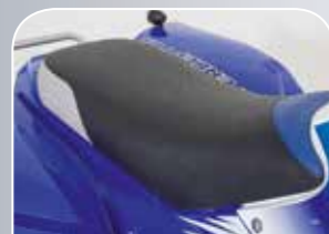
bequeme und große Sitzbank - Platz für 2 Personen