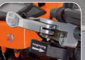
Schalthebel für Parkbremse und Rückwärtsgang