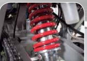
verstellbares Cross-Link Federbein hinten