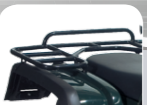
solide Gepäckträger vorn und hinten