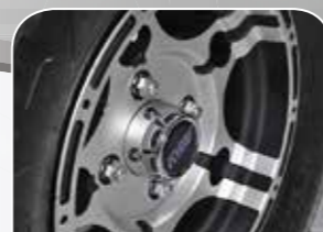
griffige Bereifung auf mo- dernen Alufelgen