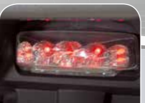
modernste, wartungsfreie LED-Rückleuchte