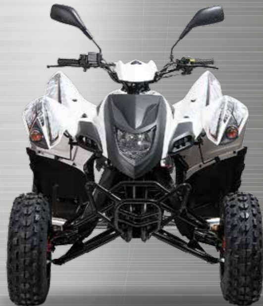
Abbildung: Hurricane 400 XS inkl. Nerfbars