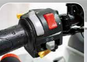
Leicht erreichbare Bedienelemente